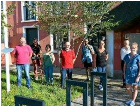
Une vidéo sera disponible sur la page Facebook de TELGRUC SUR MER – La Mairie.

Chaque cliché a reçu un bon de 10 € dans un commerce local. Ces clichés seront intégrés aux supports de communication de la commune, site internet, réseaux et journal municipal.