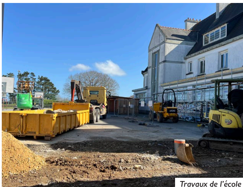
Travaux de l'école