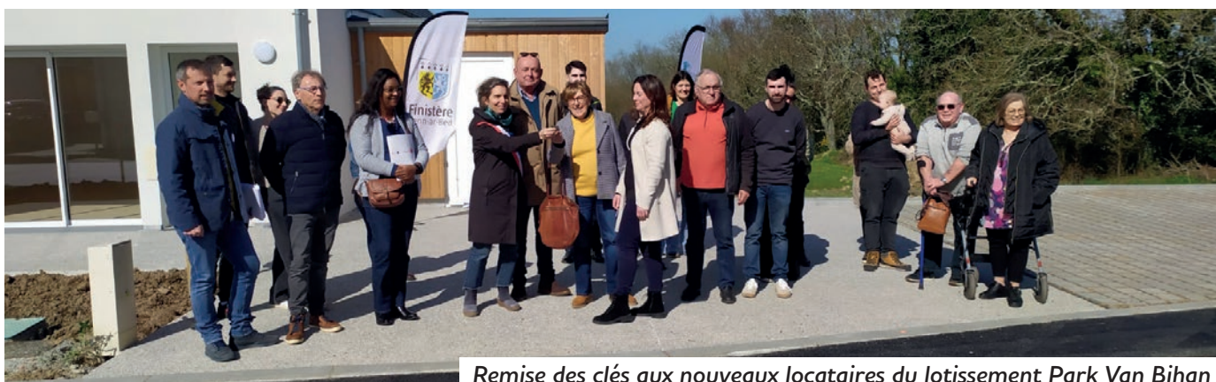
Remise des clés aux nouveaux locataires du lotissement Park Van Bihan

Prochains travaux de voirie : Rue de l'Aber, Venelle des écoles, Rue de Rosmadec, Secteur Péran+Kergonan, Secteur Le Lintant – Kergoat, Secteur La Parpelle – Kervanquen