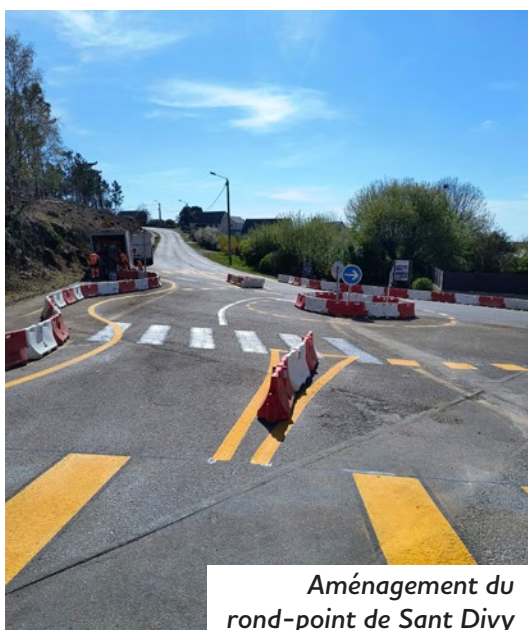
Aménagement du rond-point de Sant Divy